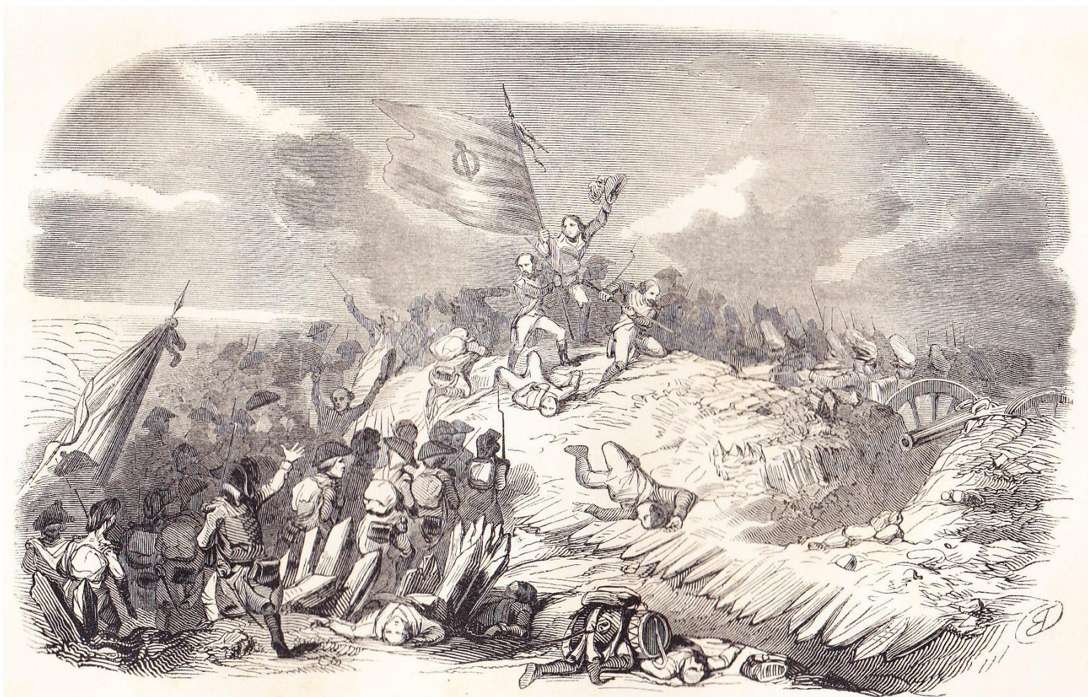
Bataille de Jemmapes.